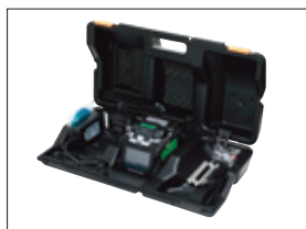
带工作台的收容箱 CC-Z1