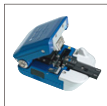
光纤切割刀 FC-7 / FC-7R 系列