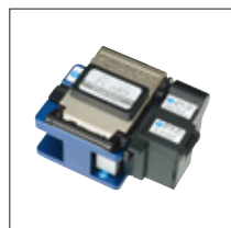
光纤切割刀 FC-6 / FC-6R 系列